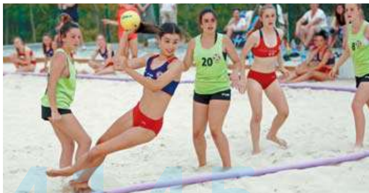
Las selecciones navarras de balonmano playa viajarán a Sanxenxo.