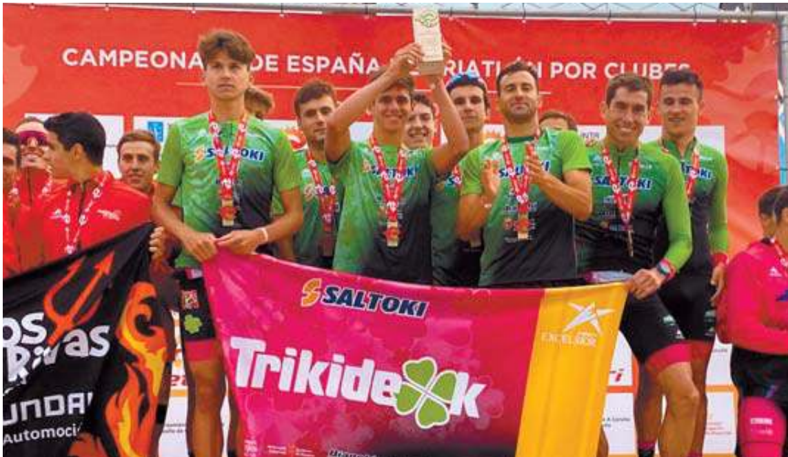
Los componentes del Saltoki Trikideak, en lo alto del podio del campeonato por clubes ayer en A Coruña.