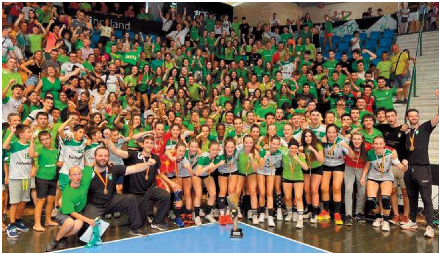
La plantilla del Helvetia Anaitasuna infantil, celebrando ayer con los aficionados su nuevo título nacional.