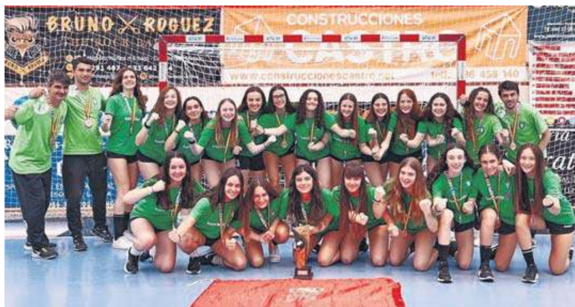
Componentes del conjunto cadete del Helvetia Anaitasuna que ayer se hicieron con el bronce nacional.

Galería con más fotos de este torneo, en www.diariodenavarra.es