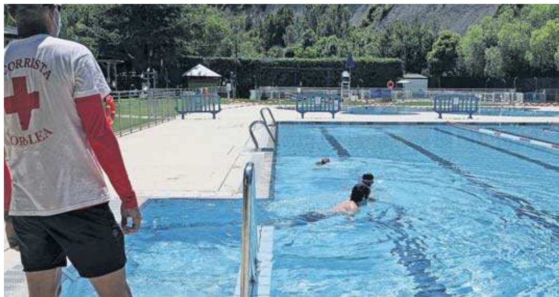
El Club Natación ya ha alertado a sus socios de un posible cierre puntual de sus instalaciones.

Desde el Club, prosiguen, se han hecho dos propuestas de subida salarial que están dentro de