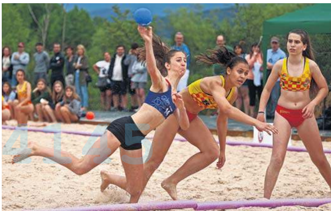
El torneo, con cientos de espectadores a lo largo de todo el día, sirve de preparación para el Nacional.