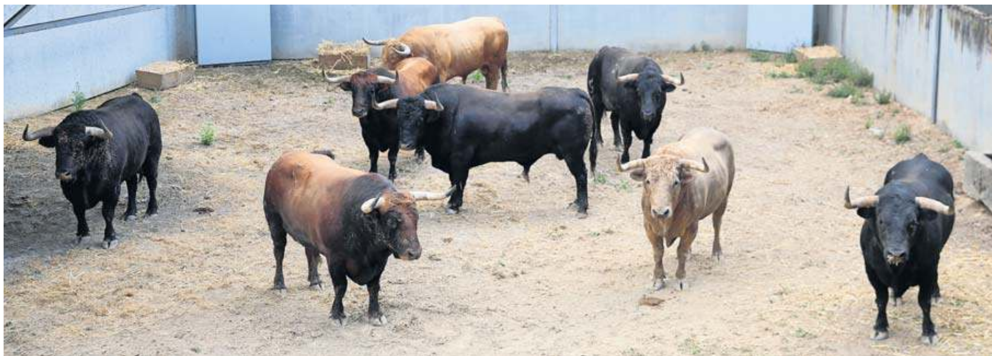
Los ejemplares del primer encierro y la corrida estelar del 7 de julio, en los corrales del Gas.