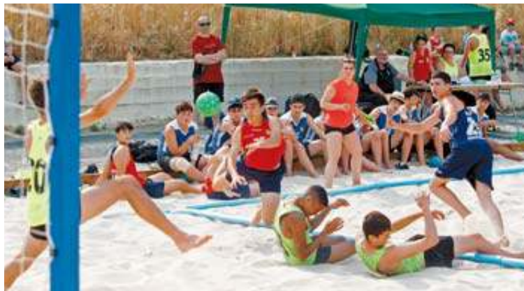
Un jugador navarro lanza tras superar a la defensa rival.

Para ello, y tras la disputa el pasado fin de semana del I Torneo del Ebro con La Rioja, Aragón y Cantabria, las selecciones forales tomaron parte ayer en las instalaciones del pabellón Ezcabarte (Azoz) en el primer Torneo Vasconavarro (Navarra, Guipuzcoa, Vizcaya y Álava). Una cita, con más de 200 jugadores, en la que se tomaron medidas por la ola de calor que puso los termómetros en 40 grados. Así, se varió el horario (evitando duelos de 13.20 a 17.20h), más duchas y se regaron los campos.