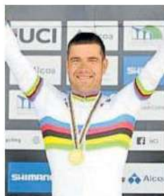
Santas, con el maillot arcoíris.

—Seguro. No tengo dudas de ello. Es cierto que este año ha habido conversaciones con la instalación y las instituciones para que se jugase un partido de la selección femenina en Navarra, pero esta temporada era quedado fuera del Mundial, todo era más extraño. Pero puedo confirmar que la selección femenina va a venir a Pamplona. No sé cuándo, pero va a venir seguro. ●