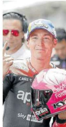
Aleix Espargaró. Foto: Efe

La atención, sin embargo, estuvo en los talleres de Aprilia, a la espera de la llegada de Aleix Espargaró, quien no defraudó a la afición y enseguida tomó asiento en su posición dentro del taller para ultimar los detalles de la clasificación antes de que ésta diese inicio. Espargaró no tardó en salir a pista, algo renqueante, pero con el ánimo intacto para intentar pelear por la mejor clasificación posible. Como el resurgir del Ave Fénix, Aleix Espargaró logró la épica. –Efe