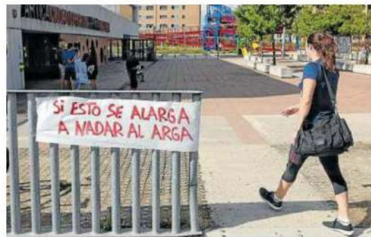
Entrada a las instalaciones deportivas de Arica.

Los convocantes son los sindicatos CCOO, ELA, LAB y UGT, que piden que el convenio "asegure como mínimo" las subidas referenciadas al IPC y recoja las peticiones de reducir la jornada laboral, mejorar la cobertura en bajas y mejorar las vacantes, han señalado en un comunicado. Explican que "tras el éxito de la huelga del 11 de agosto y viendo que la patronal no ha realizado movimiento alguno", repiten la convocatoria que pretende "desbloquear la negociación del Convenio, paralizada desde antes del verano". Los sindicatos dicen tener "disposición de negociar