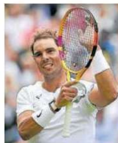
Nadal, en Wimbledon 2022.

El de ayer es el primer oro individual en un Mundial para el ciclista de Tarazona, oro en 2014 en velocidad por equipos C1-5 mixto. Santos tiene en su palmarés 15 medallas en Mundiales (2 oros, 5 platas y 8 bronce), además de una medalla olímpica. — Eje