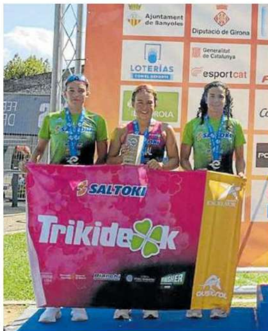
Las chicas del segundo podio sub-23.

En el mismo entorno de Banyoles se disputaron el 27 de agosto los campeonatos de Europa de relevos mixtos por clubes, donde tomó parte Saltoki Trikideak consiguiendo el noveno puesto. — Diario de Noticias