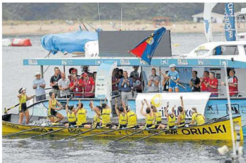
Celebración de la tripulación del equipo femenino de Orio.

PIRAGÜISMO – La selección española puso el broche a su participación en los Europeos de piragüismo eslalon sub-23 y junior de Ceske Budejovice (República Checa) con tres nuevas medallas en la última jornada. Pau Echaniz se colgó el oro en la final de K1 extremo; Olatz Arregi, la plata en K1 extremo; y Markel Imaz, el bronce en C1 junior de eslalon. – Efe