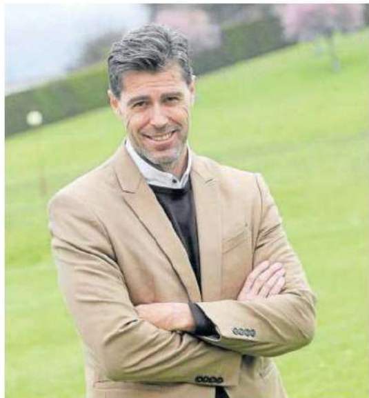
Raúl Chapado, presidente de la Federación Española.