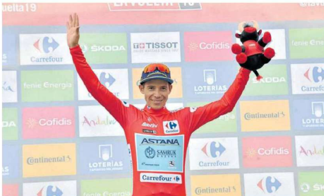
El ciclista colombiano Supermán López, celebrando su podio en la Vuelta a España 2019.