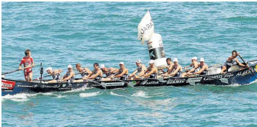
Victoria de Urdaibai en la Liga Euskolabel, bandera de Zarautz.