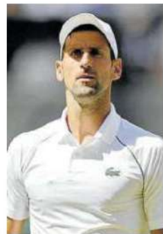
Novak Djokovic.

REMO — Las clasificatorias de la Bandera de La Concha tendrán lugar el 31 de agosto (masculina) y el 1 de septiembre (femenina). La Bandera de La Concha volverá a contar con la presencia de público tras dos años de restricciones por la pandemia. — Efe