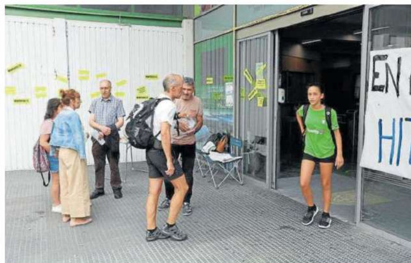
Piquete informativo a la entrada de la Sociedad Deportiva Anaitasuna.

El currículum de Hobusch deja sin embargo, en este sentido, algunos interrogantes. Llega desde China, tras haber pasado por muy diferentes destinos, con estancias no demasiado prolongadas en cada una de ellas. Y será, eso sí, la primera vez que presida una fábrica que, en el perímetro de Volkswagen, no deja de ser relativamente pequeña. Su buena salud, sin embargo, resulta clave para el empleo y la riqueza de una comunidad como Navarra. ●