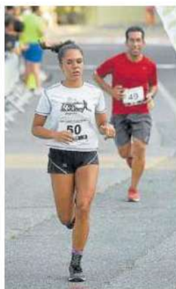
Costrada de 2021.

TENIS – La tenista española Paula Badosa no pudo terminar su debut en el torneo de Toronto, de categoría 1.000 para la WTA, ya se retiró en el ante la kazaja Yulia Putintseva, mientras que Sara Sorribes cedió ante la bielorrusa Aryna Sabalenka, y Garbiñe Muguruza superó a la estonia Kaia Kanepi desplegando un gran tenis y se medirá a la suiza Belinda Bencic, verduga de Serena Williams. Badosa, que llegó a semifinales la pasada semana en el torneo de San José (Estados Unidos), iba 7-5, 1-0 en contra cuando se retiró con aparentes problemas físicos. Las lesiones lastran a una Badosa que marchaba en una progresión estelar este 2022. —Efe