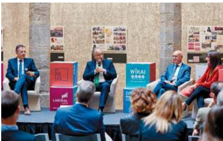
Un momento del debate Impulsar Navarra ayer en Condestable. GARZARON

El comité de empresa de la planta de Landaben solicita al Gobierno de Navarra la prórroga de esta fórmula PÁG. 20