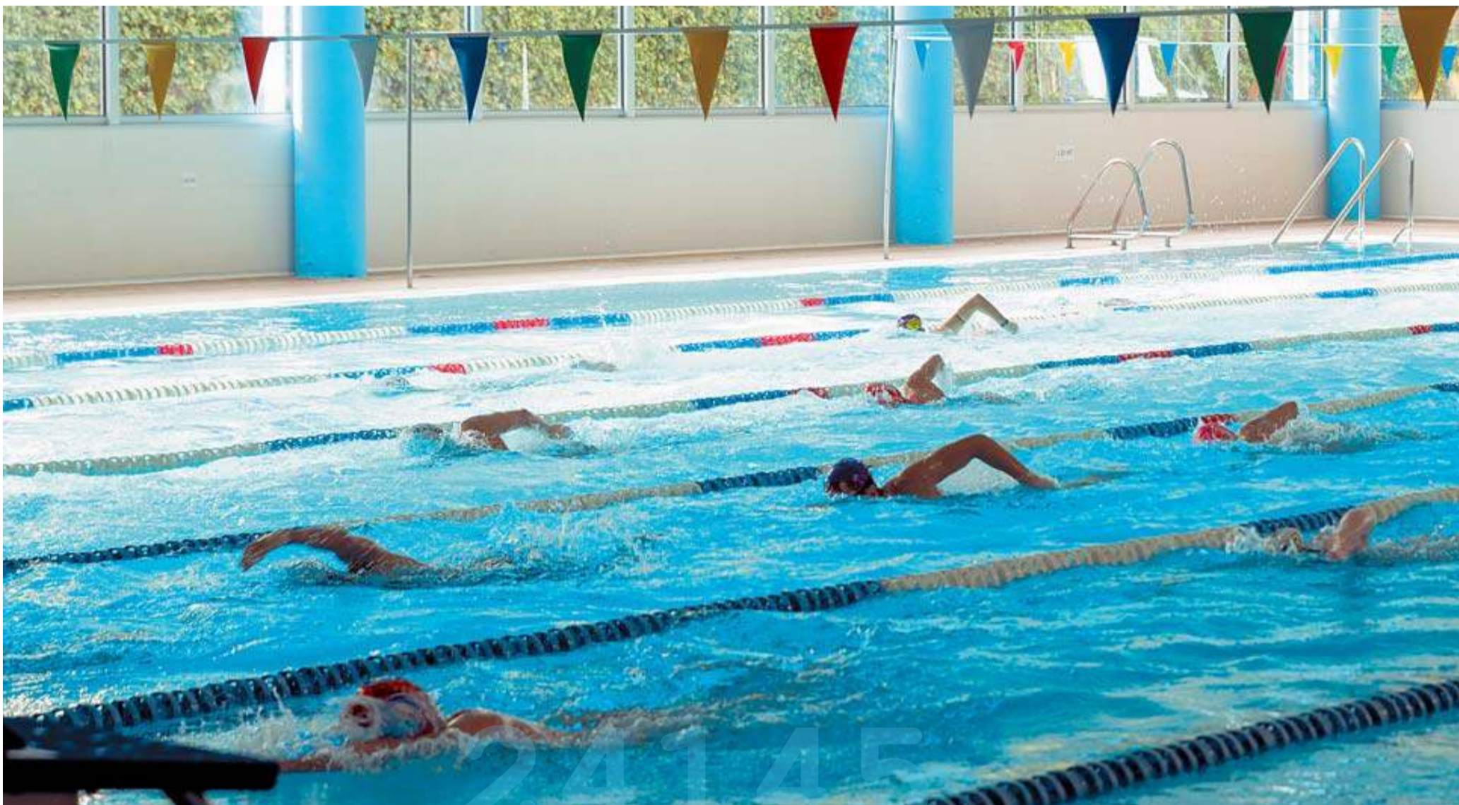
Imagen que presentaba ayer por la tarde la piscina climatizada del club Anaitasuna, de Pamplona. Varias personas ocupan las calles durante un cursillo.