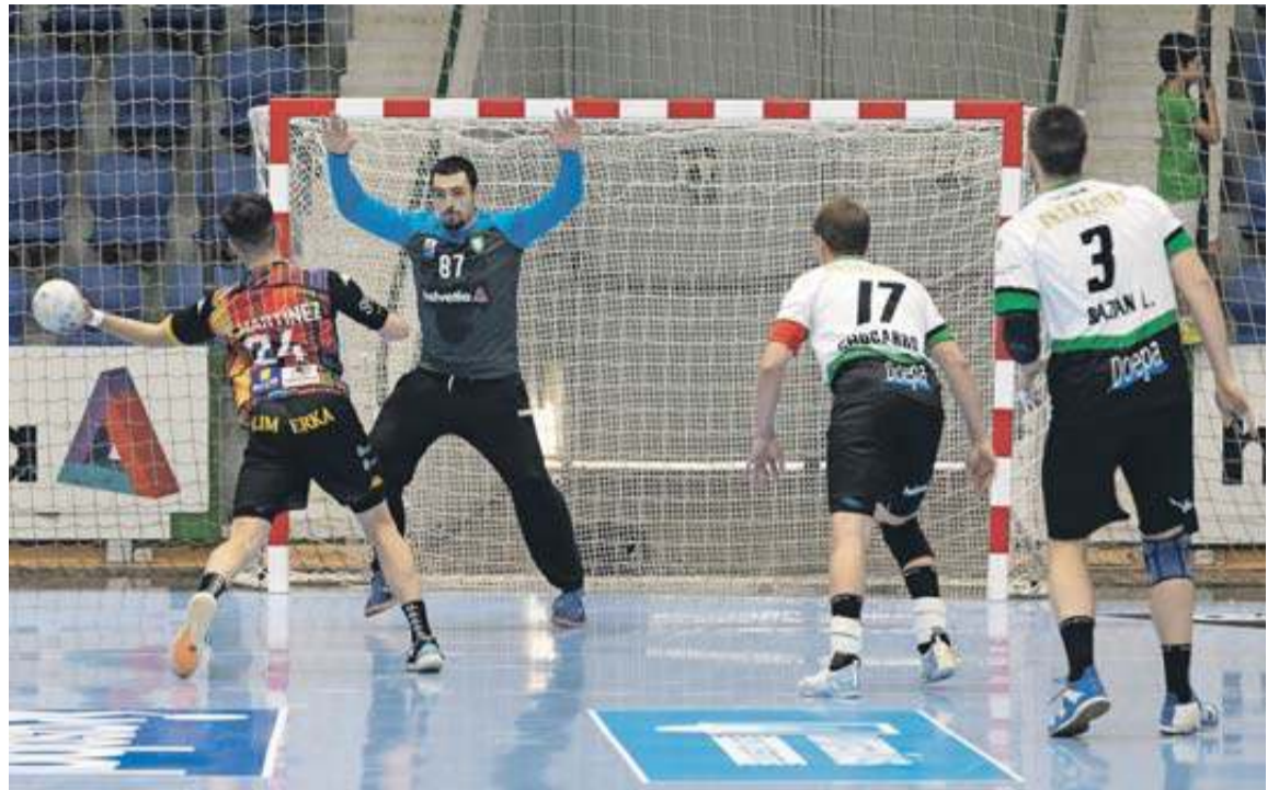
Bar, con 31 paradas de 86 lanzamientos en la estadística oficial (36,05%), en un 7 metros ante Martínez. AIZPURUA

Además, y como muestra de que la retaguardia está siendo el sólido cimiento en el que se está construyendo el proyecto de esta temporada, está el dato de que el