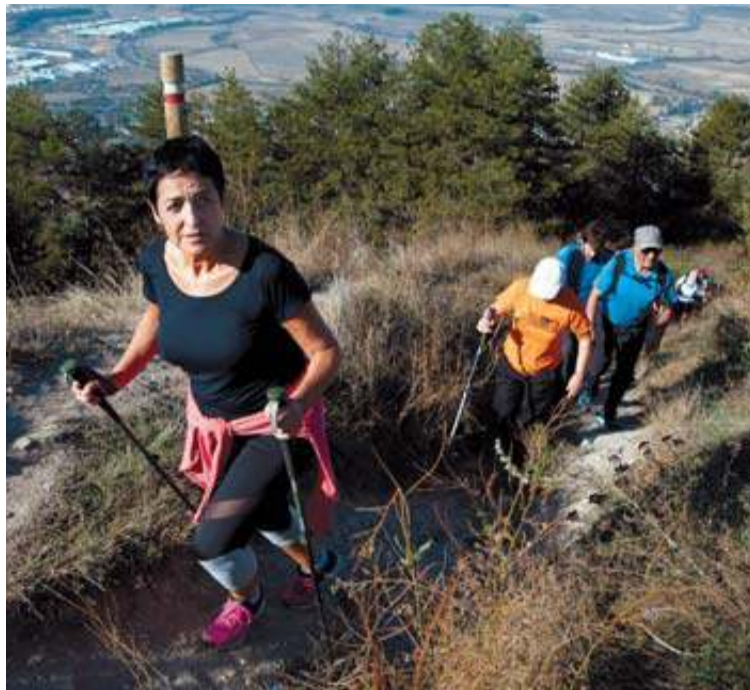
Participantes en la edición de 2019 llegan a la cumbre.

Otra de las principales novedades de esta XXVII Marcha es la fecha, adelantada a mediados de septiembre (en 2019 tuvo lugar a finales de mes), después de muchos años teniendo su fecha fijada en octubre.