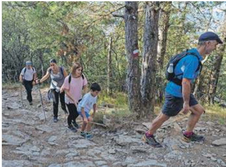
Niños, jóvenes y adultos compartieron ayer sendas y caminos. J. GARZARON