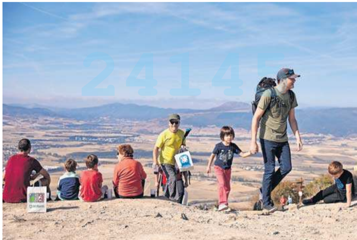
La mañana permitió disfrutar ayer con las vistas que se podían apreciar desde la cima de 895 metros. JESÚS GARZARON

Tras completar el ascenso hasta la explanada cimera, jóvenes y mayores pudieron disfrutar con las vistas de la Cuenca de Pamplona, Aralar y también de la vertiente norte (Ultzamal-