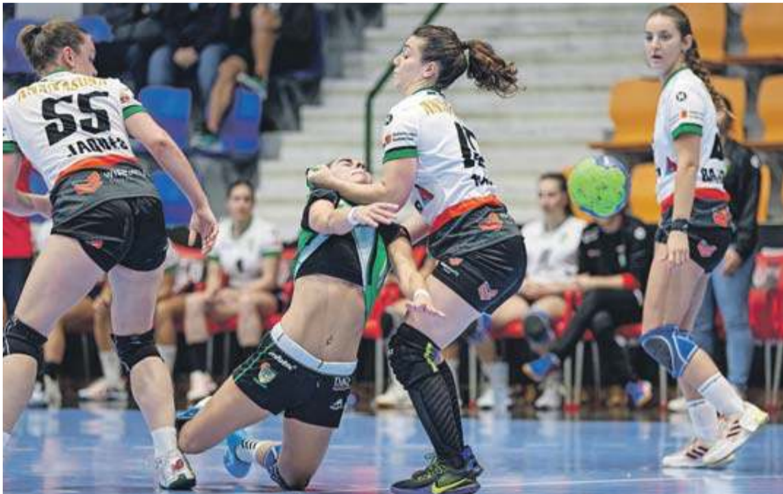
Helvetia Anaitasuna, con una efectiva defensa, frenó a Gurpea Beti Onak en el derbi de Plata femenina. J.P. URDÍROZ