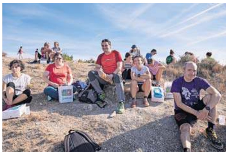
Tras el ascenso, los participantes pudieron degustar un almuerzo. GARZARON

dea...) que permitió la agradable mañana.