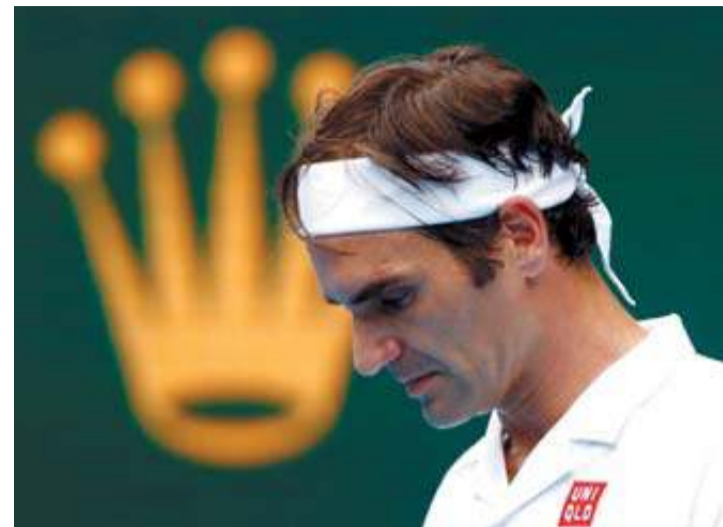
Roger Federer juega la semana que viene su último torneo.