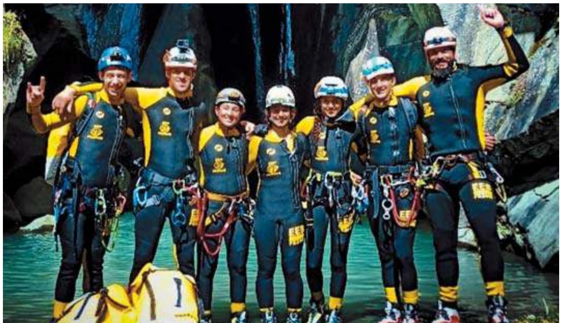
Los integrantes del Equipo Español de Barranquismo, en su primera concentración internacional en Alpes.

Unos días de convivencia que les han servido para adquirir experiencia y conocimientos, mejorando técnicas y aprendiendo otro tipo de maniobras.