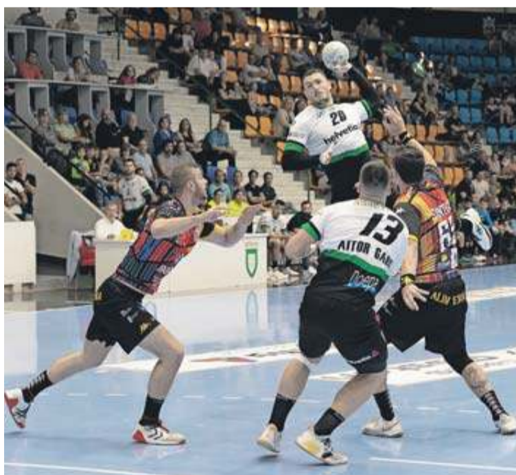
Pereira fue una de las grandes bazas ofensivas del Helvetia. IRATI AIZPURUA

Porque ayer el equipo navarro saltó a la pista con la idea de pe-