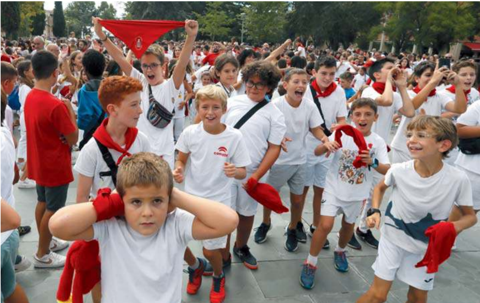
La chavalería de Zizur Mayor va a poder disfrutar de una fiestas sin tener que ir a clase en los colegios y el instituto público.