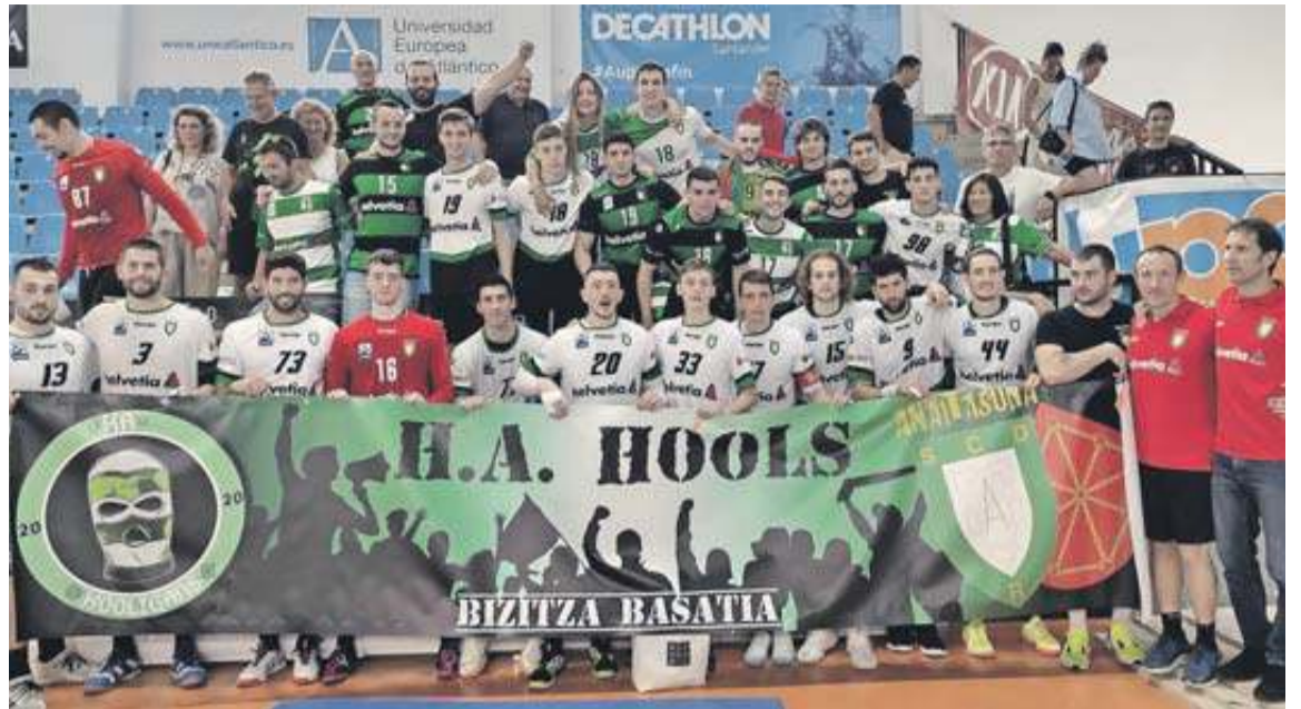
La plantilla del Helvetia posa tras el partido con el grupo de aficionados que les acompañó a Santander.