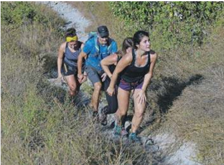
Un grupo de participantes, en los metros finales antes de la cima. J. GARZARON