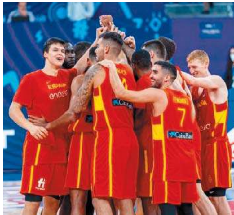
Los jugadores de la selección celebran el triunfo ante Montenegro.

Hoy se jugarán la primera posición del grupo A ante Turquía, equipo anárquico, impredecible y propenso al batacazo como demostraron ante Georgia.