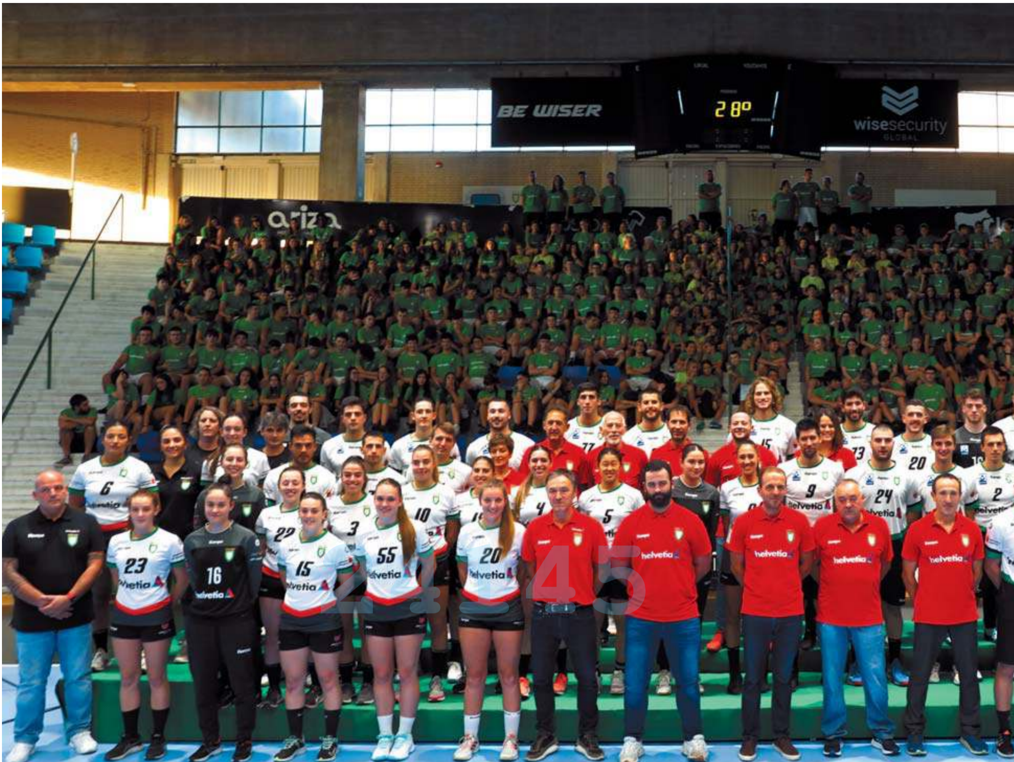
Los jugadores de todos los equipos de la S.C.D.R. Anaitasuna acudieron ayer al acto oficial de presentación del club ante más de un centenar de familiares.